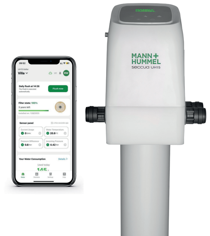
Die elektronische Steuerung über Mobiltelefone und App der Seccua UH15